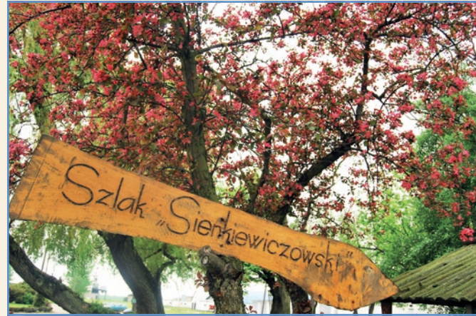
Drogowskaz kierujący do otwartego w listopadzie 2006 roku Szlaku Sienkiewiczowskiego, prowadzącego od ziemiańskiego dworu Weyherów do kolejnych miejsc pamięci, związanych z pobytom Henryka Sienkiewicza w Płońsku.

W 2006 roku, w Płońsku – z inicjatywy Towarzystwa Miłośników Ziemi Płońskiej – otwarty został Turystyczny Szlak Sienkiewiczowski. Wiedzie on przez miejsca związane z pobytom pisarza w Poświętnem bądź go upamiętniające. Na trasie Turystycznego Szlaku Sienkiewiczowskiego znajdują się m.in.: dwór Weyherów w Poświętnem, zwany „Sienkiewiczówka”, Alejka Oleńki i Aleja Lipowa w parku poświęckim, grób rodziny Weyherów na płońskim cmentarzu parafialnym oraz placówki istniejące na terenie miasta, które obrały za patrona Henryka Sienkiewicza: Miejska Biblioteka Publiczna i I Liceum Ogólnokształcące. Na szlaku znajdują się również te spośród płońskich restauracji, których kuchnia oferuje dania noszące nazwy związane z postaciami z powieści sienkiewiczowskich.