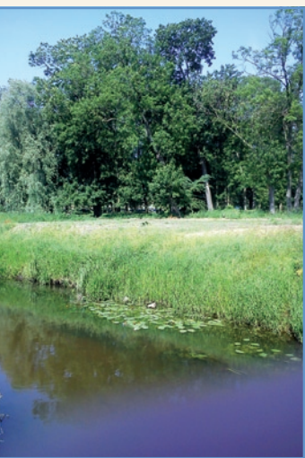
Pozostałości XIX-wiecznego parku podworskiego w Poświętne. Zdjęcie wykonane w 2012 roku.