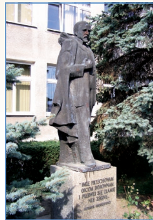
Pomnik Henryka Sienkiewicza odsłonięty 30 listopada 1978 roku przed siedzibą Szkoły przy ulicy Płockiej.