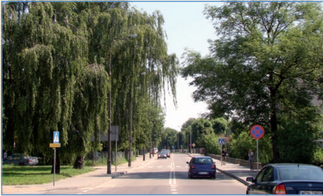
Ulica Henryka Sienkiewicza w Płońsku, widok od strony ulicy Grunwaldzkiej.

no: „(...) w sierpniu 1865 szosą Poświętne – Płońsk kroczyła przyszła europejska literatura nadobna obok przyszłej europejskiej astronomii, prowadząc ze sobą najprawdopodobniej zdawkową, towarzyską rozmowę”.