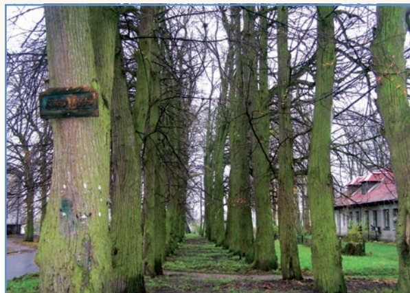
Aleja lipowa na terenie parku podworskiego w Poświętnem na obrzeżach współczesnego Płońska, nazwana od imienia jednej z postaci „Trylogii” Henryka Sienkiewicza, Aleksandry Billewiczówny, „Alejką Oleńki”.

Tuż obok dawnego dworu rodziny Weyherów znajdują się pozostałości parku, który tak zachwyił młodego Sienkiewicza, iż został przez niego opisany w jednym z jego listów. Zachowały się dwie zabytkowe aleje lipowe będące niegdyś częścią parku. Jedną z nich, na pamiątkę pobytu Henryka Sienkiewicza w Poświętnem, nazwano Alejką Oleńki, a tuż obok umieszczony został pamiątkowy głaz z tablicą, na której widnieje napis: „Dokąd zmierzasz, Człowieku... Henrykowi Sienkiewiczowi w 140. rocznicę Jego pobytu w Poświętnem – Płońszczanie”.