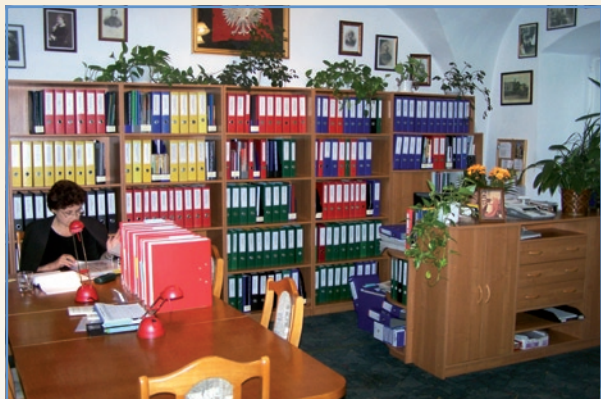
Czytelnia Pracowni Dokumentacji Dziejów Miasta Płońska.

realizowane są spotkania edukacyjne z dziećmi i młodzieżą poświęcone dziejom Płońska i ziemi płońskiej oraz ludziom, których osobowość i praca wywarły wpływ na jego rozwój. Organizowane są spotkania tematyczne poświęcone m.in.: dzieciom rodu Weyherów, historii miejsc na ziemi płońskiej, z którymi byli związani, oraz przypominające niewątpliwie największy ich wkład w dziedzictwo kulturowe Płońska, jakim było zaproszenie do siebie latem 1865 r. przyszłego pisarza i noblisty, Henryka Sienkiewicza.