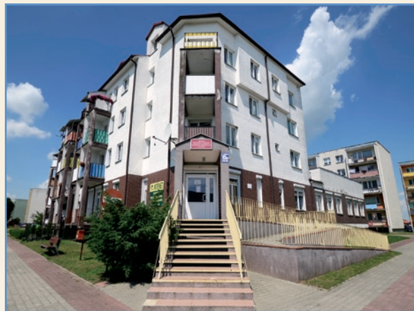
Siedziba Miejskiej Biblioteki Publicznej im. Henryka Sienkiewicza przy ul. Północnej w Płońsku