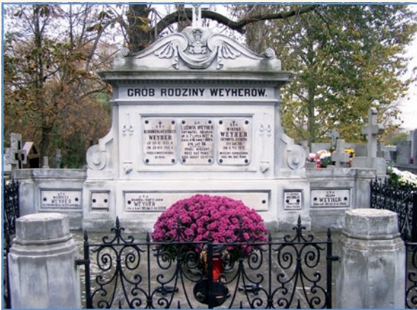
Grobowiec rodziny Weyherów na cmentarzu parafialnym w Płońsku.